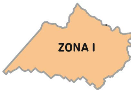
Imagen 2. La Zona I está conformada por los Partidos: ARRECIFES, BARADERO, CAPITÁN SARMIENTO, CARMEN DE ARECO, COLÓN, PERGAMINO, RAMALLO, ROJAS, SALTO, SAN NICOLÁS y SAN PEDRO.