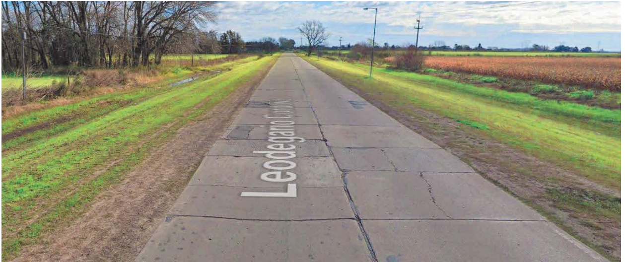
Imagen 4. Deterioro en losas Cno. 098-02 Partido de San Nicolás