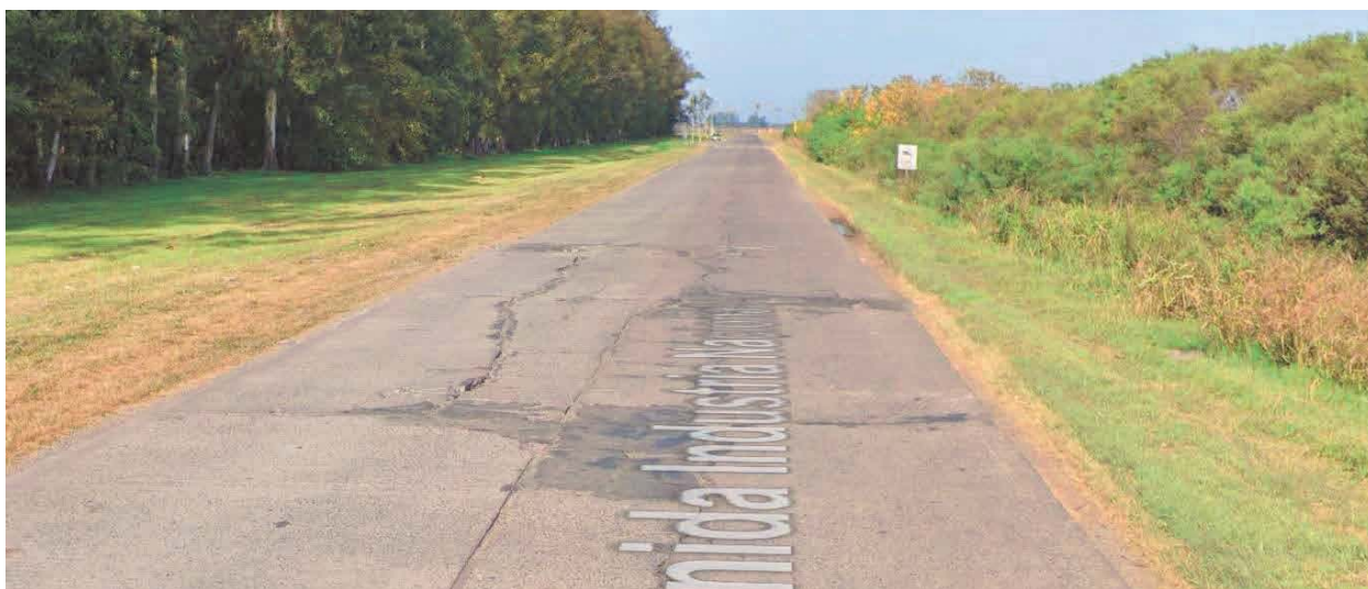
Imagen 3. Deterioro en losas Cno. 087-01 Partido de Ramallo.

En las siguientes imágenes se puede observar el deterioro de Rutas de Zona I (tanto de las redes primarias como de las redes secundarias).