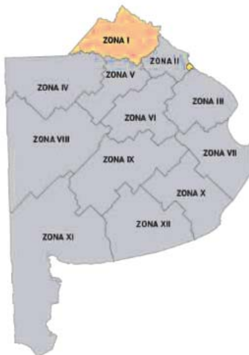
Imagen 1. División de Zonas Viales de la Provincia de Buenos Aires

En las siguientes imágenes se muestra la Zona I sobre la Provincia de Buenos Aires, la cual será el área a intervenir: